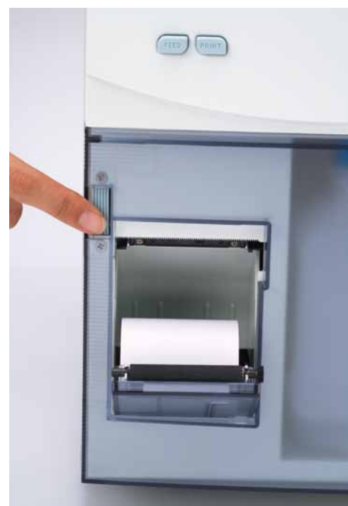
Very easy to set printing paper ワンタッチでプリント用紙をセットできます。